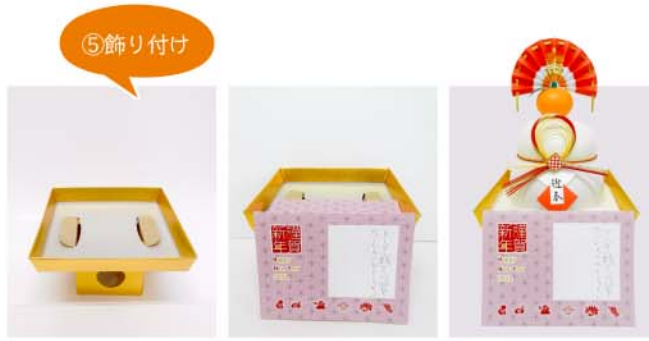
金三方を用意 前紙をセット お餅をセット