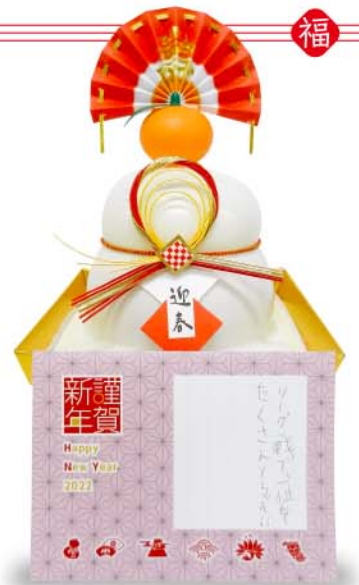
仕上がりイメージ